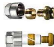
Adaptateurs compression par collecteur

Référence de la liste de prix : RMA, 076 – Collecteurs et accessoires pour chauffage radiant