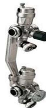
Ensemble pour dérivation de pression différentielle