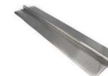
Plaquette de transfert de chaleur